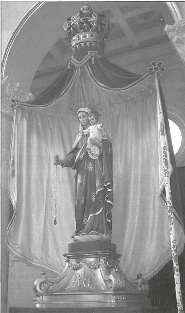
L-Istatwa tal-Madonna tar-Rużarju

Hija statwa li għalkemm sempliċi, hija ħelwa. Bla dubju ta’ xejn l-isbaħ partijiet tagħha huma l-uċuħ tal-Madonna u ta’ Ġesu’ Bambin u l-velu li mpitter b’mod tassew professjonali - tant li taħsbu verament trasparenti. F’dawn l-aħħar 50 sena qatt ma sarilha restawr u fil-fatt id-daqqiet tal-furmaturi tal-iskultur għadhom viżibbli. Originarjament l-istatwa kellha diadema forma ta’ ċirku bi tnaħ-il kewkba imma fis-sena 1989 kien inħadem stellarju mis-Sur Ġoġ Cordin u mieghu kien inħadem ukoll wieħed għall-Bambin. Jingħad li din l-istatwa