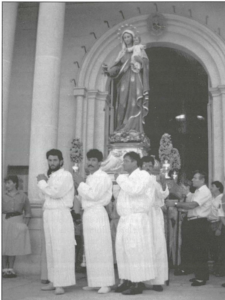
Fil-purċissjoni 1988 meta Birzebbuġa kienet qed tiċċelebra il-75 sena Parroċċa