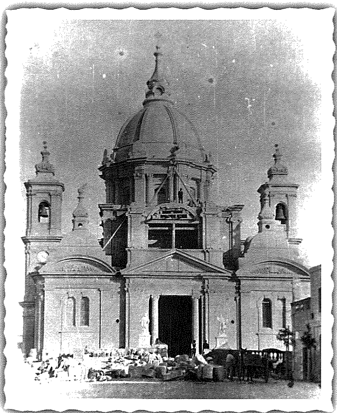
Il-Koppla tal-Knisja Parrokkjali tan-Nadur lesta. Ritratt li juri l-bini tal-faċċata tal-Knisja fl-aħhar fażi tax-xogħol tagħha fis-sena 1915.