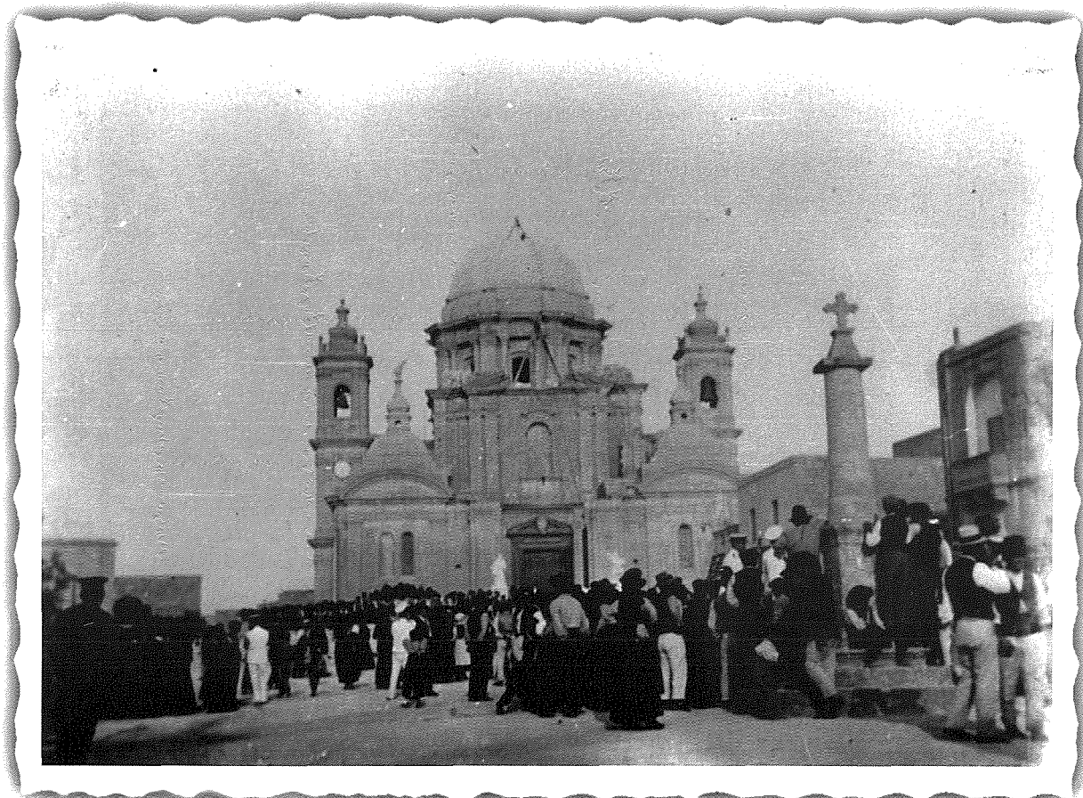
Mitt Sena Ilu. Il-fażi tal-bini tal-Koppla tal-Knisja Parrokkjali tan-Nadur hekk kif kien fil-festa tal-Imnarja ta' mitt sena ilu, fis-sena 1913.