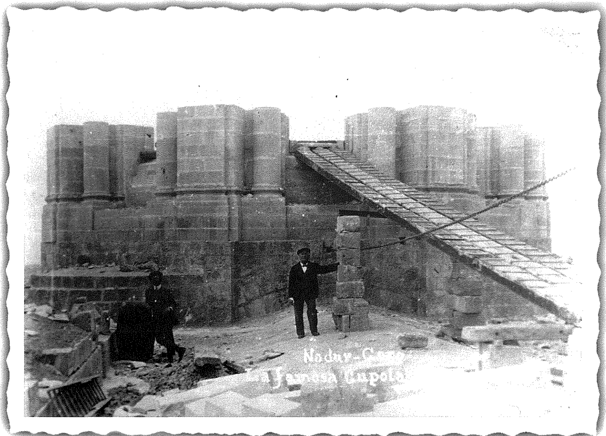
Il-bidu tal-bini tal-Koppla tal-Knisja Parrokkjali tan-Nadur. Ritratt meħud fil-bidu tal-ewwel fażi tax-xogħol fis-snin 1911 / 1912.