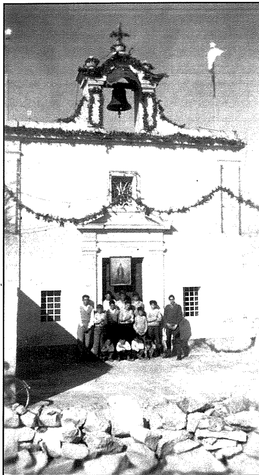
Il-kappella tal-Kuncizzjoni mżejna bil-liedna tal-haxix għall-festa, fis-snin 50.

furbani. It-torri l-ahmar (kif kien maghruf) illum m'ghadux hemm, ghax dan kien twaqqa' mill-awtoritajiet militari Ingliži fl-1915. Barra minhekk sal-lum f'Benghajsa f'post maghruf bhala l-Mara ghad hemm (ghalkemm abandonata) il-Fortizza ta' Benghajsa. Din kienet inbniet fuq medda ta' madwar 40 tomna ta' art mill-Awtoritajiet Militari Ingliži sabiex tattakka ghal fuq il-bahar. Ftit 'il boghod minn din il-fortizza l-Ingliži kienu bnew fortizza oħra żghira maghrufa bhala l-Fortizza ta' l-Gholja. Din il-fortizza kienet inbniet sabiex tattakka għall-ajru. Dawn iż-żewġ fortizzi taw sehem siewi fit-tieni gwerra dinjija, fejn naraw li l-ewwel attacki mwettqa mill-ghadu fuq pajjiżna fil-11 ta' Gunju 1940 saru proprju fuq dawn iż-żewġ fortizzi u fuq Kalafraña fejn kien hemm it-Torpedo Depot tal-baži Ingliża.