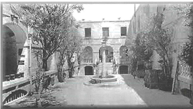
Il-bitha tal-Casa di Carità

Fuq iskrizzjoni bil-Latin li kienet tinsab f'dan il-bini, wieħed jista' jifhem il-ħsieb wara l-bini ta' din l-istruttura. Kienet tgħid li l-Gran Mastru de Vilhena, wara li bena l-famuża fortizza (Forti Manoel), ħallas minn butu għall-bini ta' post li jagħti kenn lill-persuni mit-tbatija tax-xjuħija, kenn lil tfajliet mit-tentazzjonijiet tad-dinja u nies oħra mill-oppressjoni tal-faqar 5 .