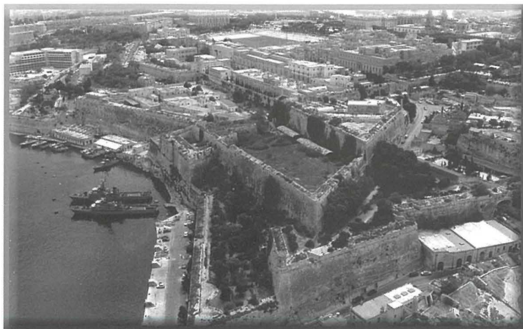
Is-sit fejn kien jinsab l-Ospizju

Fil-11 ta' Novembru 1885, saru rakkomandazzjonijiet biex flok l-Isptar Ċentrali jinbena sptar ikbar ta' 354 sodda. Sa ftit snin wara, dawn il-pjanijiet kienu ġew imwarrba u l-Isptar Ċentrali tal-Furjana baqa' l-isptar