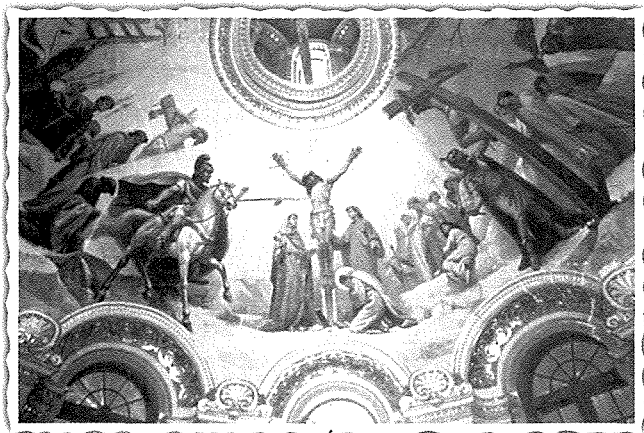
Dettall mill-pittura tal-koppla.

lil Santa Marija Alacoque u d-dehra ta' Ġesu` lil San Gwann Eudes; saċerdot fundatur tal-Kongregazzjoni ta' Ġesu` u Marija. Fis-saqaf imbagħad naraw is-seba` sacramenti. Ma' din il-pittura insibu ukoll xogħol ieħor ta' skultura maħduma mill-artist diġa` magħruf dak iż-żmien man-Nadurin Francesco S. Sciortino li kompli jikkomplimenti s-sbuhija tas-saqaf u l-koppla ta' din il-knisja.