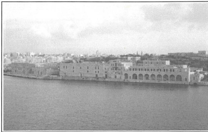
Fejn kien l-Isptar ta' Lazzarett

Skond wieghda li kienet saret meta laqtitna din il-marda, il-Maltin kellhom jaghmlu tridu u processjoni solenni bhala radd il-hajr lil Alla li bieghed dan il-flagell. Dan it-tridu sar fil-Kolleggjata ta' San Pawl Nawfragu fil-Belt. Il-processjoni saret wara quddiesa solenni li saret fl-istess knisja u wara nofs in-nhar il-processjoni bl-istatwa u r-relika ta' San Pawl, telqet ghall-knisja ta' San Publju fil-Floriana. Matul it-triq il-processjoni