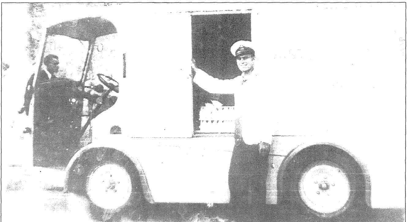
Wiehed mill-ewwel vannijiet għad-distribuzzjoni tal-bejgħ tal-halib ippasturizzat. Il-bejjiegh bil-beritta u l-uniformi tal-M.M.U.

Hajr lil Billy Morgan tar-ritratti u lil Hector Farrugia tar-riċerka.