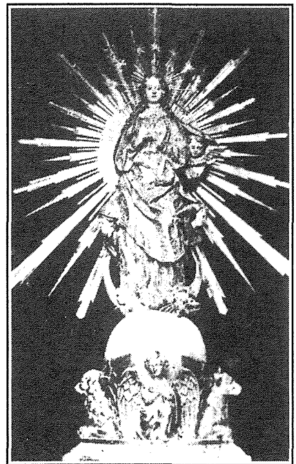
L-Istatwa fl-antik qabel ma ġiet miksija bil-fidda.