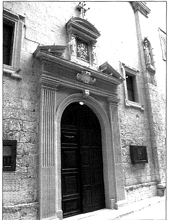
Il-kappella ta' San Pietru u San Benedittu fl-Imdina

Din il-kappella nbiet fl 1728 minflok dik illi kien hemm qabilha. L-istorja turi li fis-seklu Sittax, f'Hal Lija kienet diġà teżisti knisja f'għieħ San Pietru. Fl-1575, Monsinjur Dusina żar dan ir-rahal u ra din il-knisja li dak iż-żmien kien jieħu hsiebha Theramus Vassallo. Fis-sena 1615 l-Isqof Caglires żar din il-kappella u nnota li din il-kappella kienet żdingata, tant illi ddecieda li jipprofanaha. Iżda maż-żmien, Dun Żakkarija Sammut irrangaha mill-gdid u reġa' fetaħha.