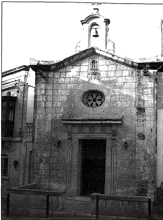
Kappella San Pietru - Qormi

Camarosa, fi zjara f'Hal Qormi kien sab il-kappella fi stat hazin hafna ghalhekk kien ghalaqha. Illum il-gurnata, il-kappella tinsab restawrata, inkluż il-Kwadru Tġulari li juri l-Martirju ta' San Pietru Appostlu u tintuża għall-Adorazzjoni Perpetwa. Aktar dettall dwar din il-kappella jista' jinstab f'artiklu li kien inkiteb minn Christopher Bonnici fuq din il-pubblikazzjoni, fis-sena 2012.