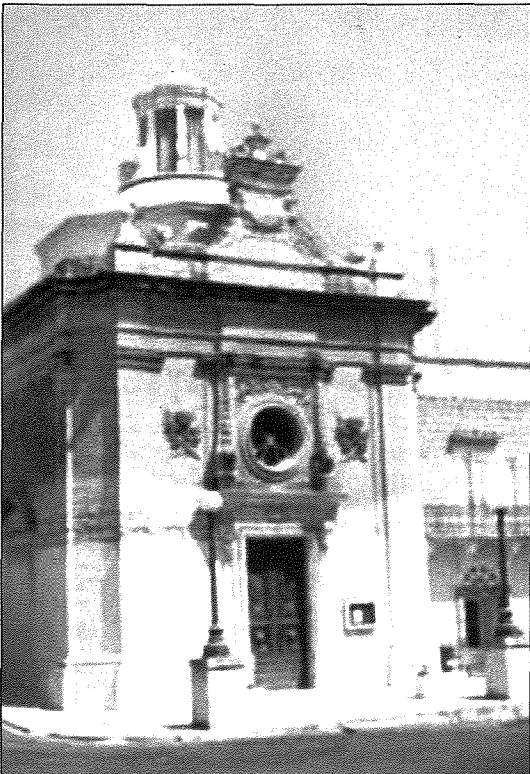
Il-kappella ta' San Pietru f'Hal Lija

F'rahal is-Salvatur ukoll insibu kappella ddedikata lil San Pietru u tappartjeni lill-patrijiet Dumnikani. Quddiem din il-kappella tinsab tiddomina statwa sabiha ta' San Pawl Appostlu li nħadmet mill-iskultur Salvu Dimech.