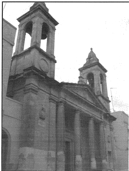
Kappella tad-Duluri: Dehra generali tal-faċċata kif inhi llum.

Mal-faċċata wiehed isib cables tad-dawl, pajpijiet u msiemer. Fejn kien hemm affarijiet mwahħlin mal-faċċata u eventwalment inqalġu, dan halla l-hsara u f'ċertu postijiet il-ġebbla nqassmet jew xpakkat.