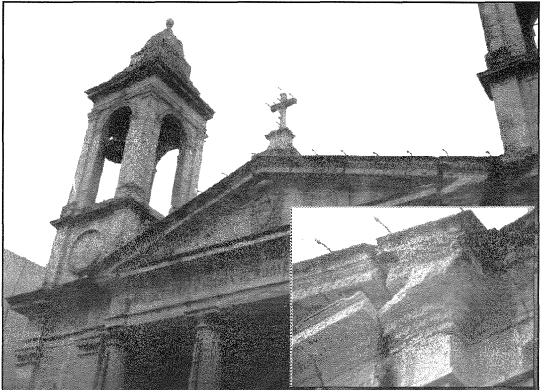
Kappella tad-Duluri: Il-parti ta' fuq tal-Kappella hija mahmuġa hafna b'biological patina u hsarat fil-ġebli (insert)

Konsegwentament, f'1 ta' Ottubru 2012 ġew kompluti l-formalitajiet relatati mal-permess (PA/02411/12) u minn hemm beda l-proċess tal-MEPA sabiex jōhrog il-permess neċessarju. Kien stabbilit li l-permess jōhrog fi żmien 26 ġimgħa.