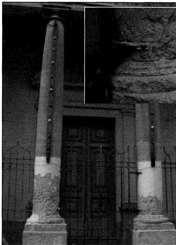
Kappella tad-Duluri: Il-bieb prinċipali, l-kancell u dettal tal-hsara kkawżata mis-sadiq tal-kancell (insert).

F'artiklu li jmiss, jekk Alla jrid, nittamaw li nagħtu deskrizzjoni fid-dettal tal-interventi kollha li saru sabiex toħroġ is-sbuhija ta' dan il-ġojjel arkitettoniku, li illum hi parti integrali mill-istorja ta' ħafna minna li, jew kienu jirċievu s-Sagramenti, jew kienu jiġu ppreparati għas-Sagramenti permezz tat-tagħlim tas-Socjetà Duttrina Kristjana (M.U.S.E.U.M.) li kien isir d'din il-kappella sas-sena 2009.