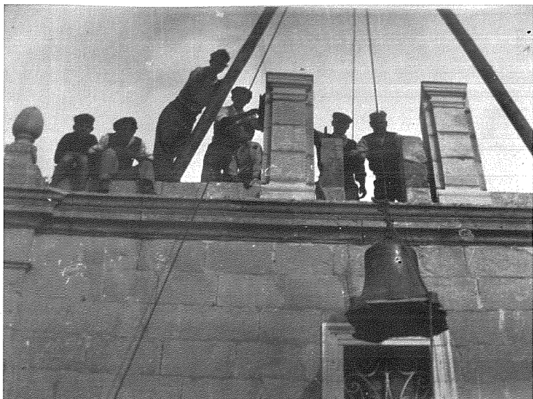
Il-qanpiena bl-isem ta 'Concetta' tidher tielgħa fil-kampnar il-ġdid

ohra li kien hemm qabel li kienet inqasmet. Il-qanpiena kienet ittelligħet fil-kampnar fis-sena 1947 u tbierket mill-kappillan Dun Anġ Fenech. Fuq wara hemm qanpiena ohra iżgħar bl-isem ta' 'Montabello'. Din kienet fuq vapur u nġiebet min Manoel Island fi żmien il-gwerra.