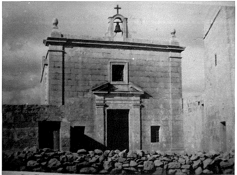
Il-faċċata tal-Kappella bil-qanpiena il-qadima.