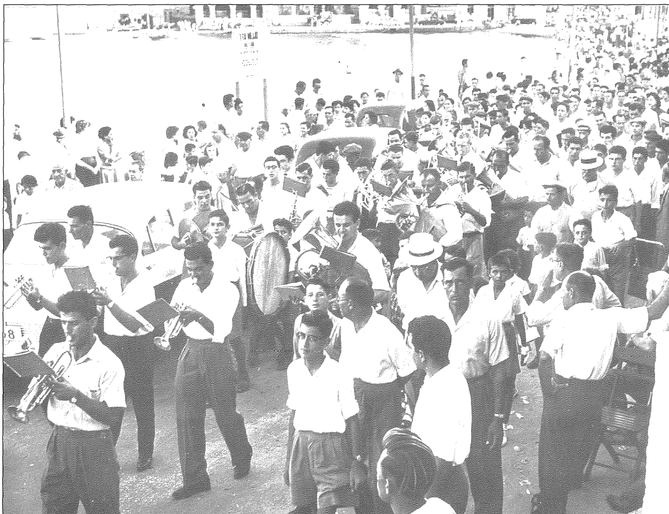
Il-Banda San Pietru għadejja mix-Xatt fl-1958.

Tagħrif miġbur minn Ivan Zammit u li gie mehud mill-ktieb 'Nofs Seklu ta' Mixxa Mużikali' ppublikat fl-2007 fl-okkażjoni tal-50 sena mit-twaqqif tal-Għaqda Mużikali San Pietru fil-Ktajjen.