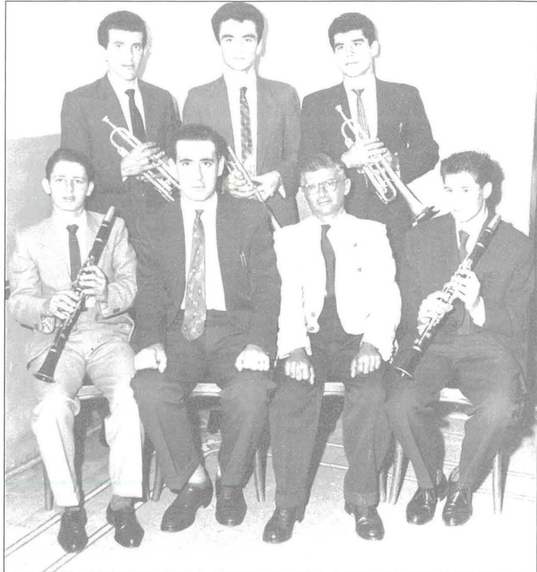
L-Ewwel Bandisti tas-Socjetà

Kif jixhed l-annu li jinsab fuq l-emblema tas-Socjetà, l-Għaqda Mużikali San Pietru fil-Ktajjen, giet imwaqqfa fl-1957 wara diversi movimenti minn bosta żgħażaġh li kienu bdew ftit snin qabel. Il-Banda San Pietru għamlet l-ewwel dehra pubblika tagħha nhar il-Hadd 25 ta' Awwissu tal-1957, meta dakinhar għamlet març madwar it-toroq prinçipali tar-rahul u wara sar programm mużikali fuq plançier li kien armat quddiem il-każin fil-Bajja s-Sabiha. Però wiehed malajr jista' jinnota li għad li din il-Banda twaqqfet bil-għan li tipparteçipa fil-festa titulari ta' San Pietru, però d-debut tagħha ma sarx fil-festa ta' dik is-sena li giet içcelebrata nhar il-Hadd 4 ta' Awwissu. Dan għall-fatt li l-Banda ma kinetx organizzata biżżejjed u għalhekk l-ewwel dehra tagħha saret propju tliet ġimghat wara. Minkejja dan, ix-xatt tal-Bajja s-Sabiha xorta wahda kien armat daqs li kieku kien jum il-festa titulari.