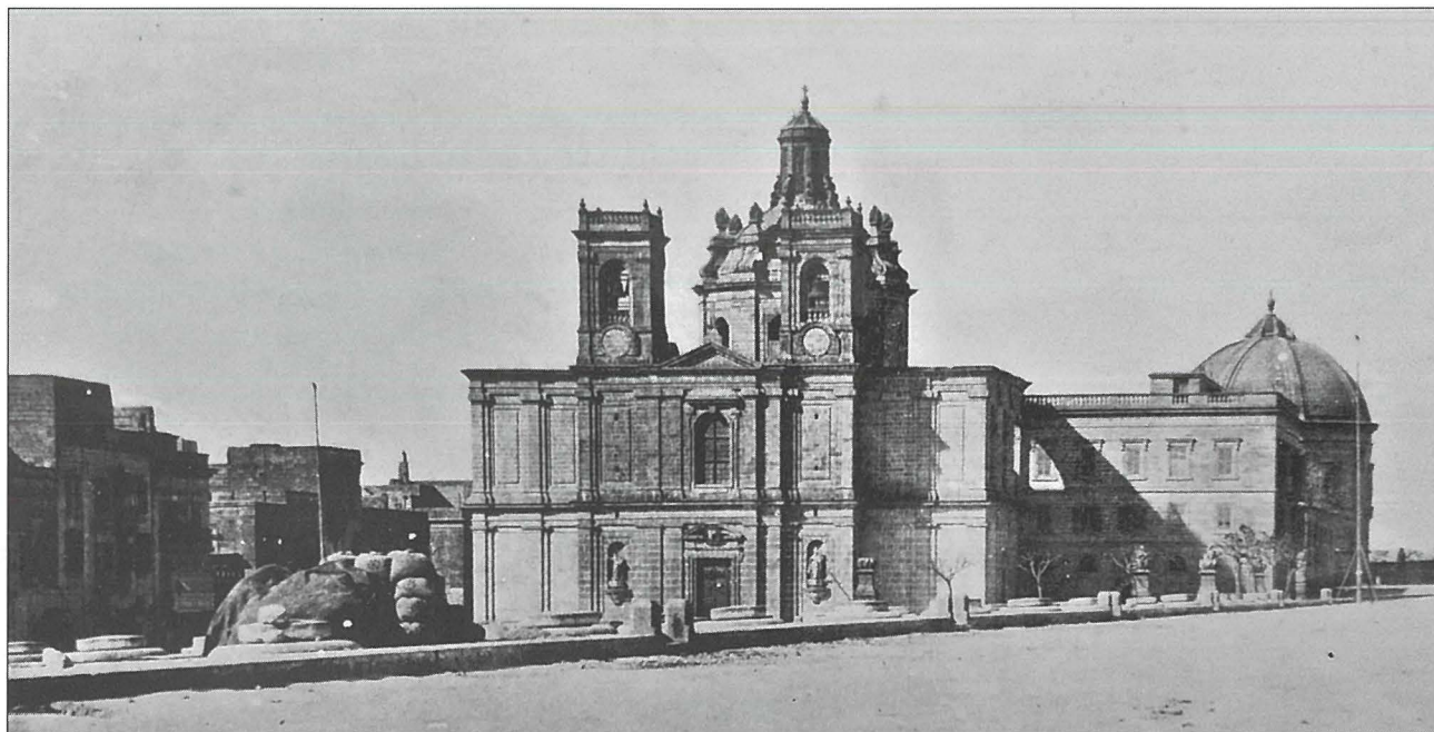
Dehra tal-knisja l-antika ta' San Publu, qabel ma kienet inkabbra kif nafuha llum.