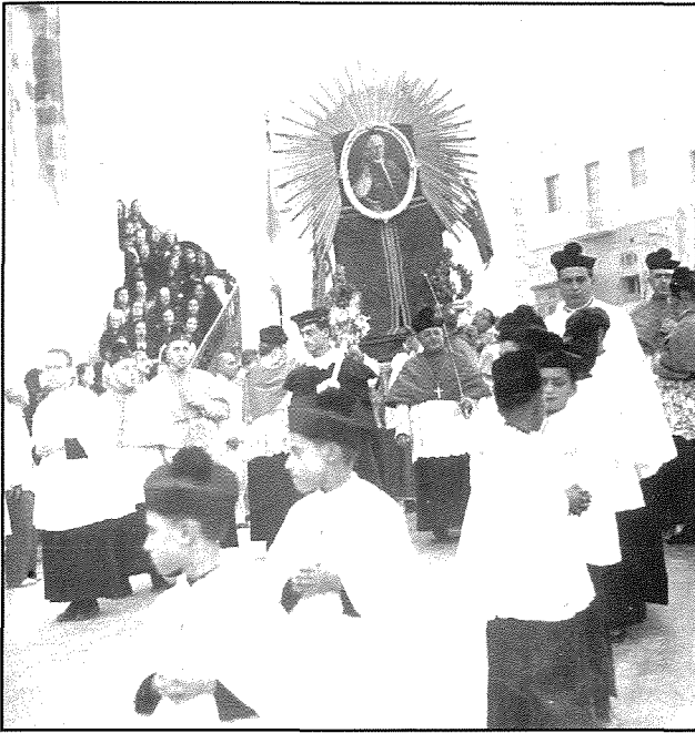
L-inkwadru tal-Papa Piju X ġej f' pellegrinagg mill-knisja ta' San Pawl

Segretarju ta' l-Istat, iżda dawn ma aċċettax u l-Papa l-ġdid kellu jsofri l-ewwel dispjaċir tiegħu fil-hatra l-ġdida bhala r-Raghaj tal-Kattoliċi. Madankollu ma qatax qalbu u wera mill-ewwel li kien se jibqa' s-sacerdot umli u qaddis li kien; is-sacerdot u l-habib ta' kulhadd. Fuq l-iskrivanija tiegħu ma poġġa xejn hlief Kurċifiss u statwa żghira tal-bronż tal-qaddis kurat ta' Ars, Jean Baptiste Vianney li huwa stess kien ibbeatifika.