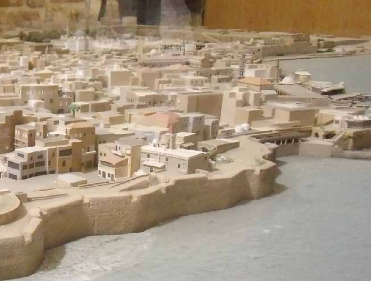
Akri, Pjanta tal-Belt Fortizza

laħam, f'atmosfera ta' taħlit ta' irwejjah tipika ta' Suq Għarbi. Parti oħra tat-toroq Kruċjati tinsab fil-kwartier tat-Templari, fix-xaqliba tal-lbiċ tal-belt. F'din iż-żona nstabt il-Mina tat-Templari, li mill-belt kienet twassal direttament sal-baħar bħala mezz li minnu t-Templari setghu jaħarbu lejn il-flotot tagħhom f'każ ta' assedju.