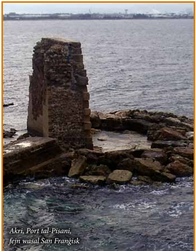
Akri, Port tal-Pisani, fejn wasal San Frangisk

Akri jew Akko hi waħda mill-aktar portijiet importanti tal-Art Imqaddsa minhabba l-pożizzjoni ġeografika tagħha u minhabba l-istorja twila u epika tagħha. Hi port li ra prosperità kbira imma wkoll bosta gwerer. Tinsab strateġikament lokalizzata qrib il-Libanu u l-gżira ta' Ċipru u għandha pjanura fertili fuq in-naħa ta' ġewwa.