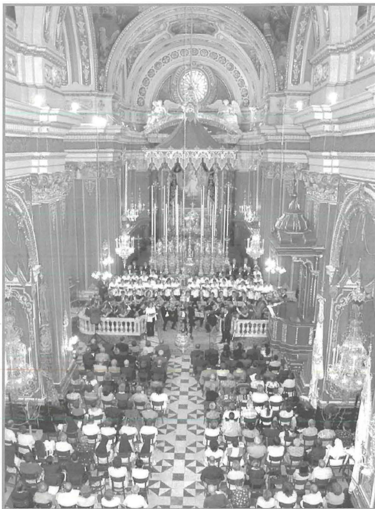
Il-Kor 'Tota Pulchra' waqt l-Akkademja li kienet saret nhar it-Tnejn 20 ta' Ġunju 2005 fl-okkażjoni tal-Mitt Sena mill-Inkurunazzjoni tal-kwadru titolari

ta' Suor Adeodata Pisani, u fil-bidu tal-Proċess tal-Kanonizzazzjoni ta' Mons. Ġużeppi de Piro. Il-Kor kien mistieden ukoll ikanta f'żewġ okkażjonijiet fil-Gżira Għawdxija, fejn fl-4 ta' Settembru 1999 kien mistieden ikanta fil-Bażilka ta' Marija Bambina fix-Xagħra fl-okkażjoni tal-Festa, u fil-31 t'Ottubru 2000 kien mistieden ikanta fil-Katidral t'Għawdex fl-okkażjoni tal-Ħamsin Sena mid-Domma tal-Assunzjoni ta' Marija. Minn qalbna nifirħulhom u nringrazzjahom tas-servizz denju li dejjem taw lill-Parroċċa tagħna senza interessi.