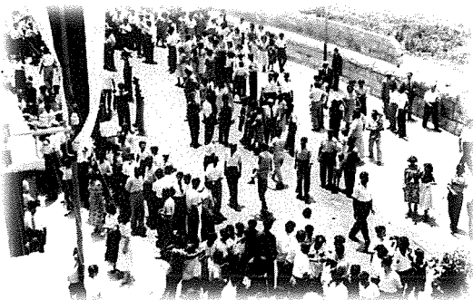
Meta l-Banda Trinità Qaddisa barġet iddoqq għall-ewwel darba fil-festa tas-SS.ma Trinità nbar il-Hadd, 12 ta' Ġunju, 1949. Fuq il-lemin jidher il-kanal tal-ġebel minn fejn kien iġhaddi d-drenaġġ

Lord Strickland meta kien Segretarju tal-Gvern ta' Malta kien hadem biex is-sistema tad-drenaġġ tibda tinfirex fil-gżejjer Maltin. Peress illi d-drenaġġ kien jinsab fl-inhawi l-iktar fejn kienu n-nies tas-Servizzi Ingliżi, Strickland ried ukoll li jifrex is-servizz tad-drenaġġ f'dawk il-postijiet li kienu mgħammra mill-Maltin.