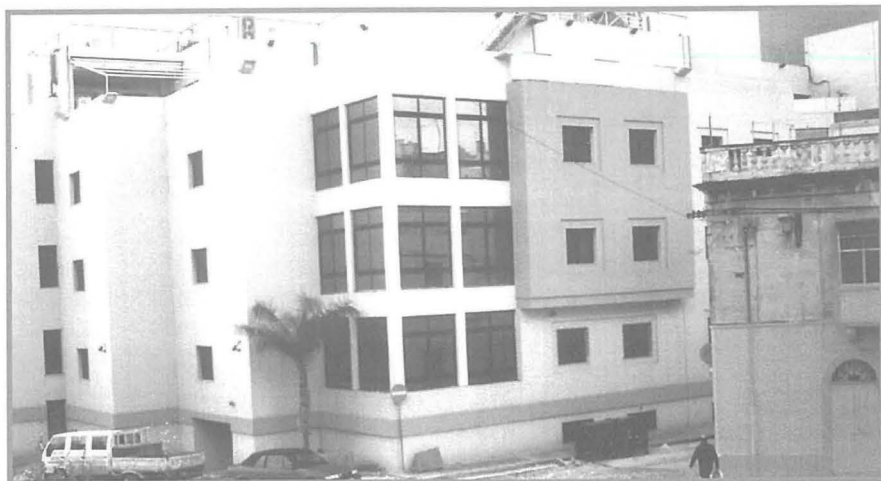
F'dan ir-ritratt tidher il-binja tal-kumpanija GO eżatt fejn kienet teżisti l-kamra bit-Tork fuqha u fejn biswita nstab il-fdal ta' Ċimiterju Musulman fil-11 ta' Frar 2012.

Sakemm ix-xogħol dam wieqaf sar studju dettaljat fuq il-post biex tiġi identifikata u analizzata s-sejba tant importanti għall-istorja ta' Malta. Għalkemm jissemma ħafna drabi li kien jeżisti dan iċ-ċimiterju, l-istorja ma tgħidilniex il-post eżatt fejn kien