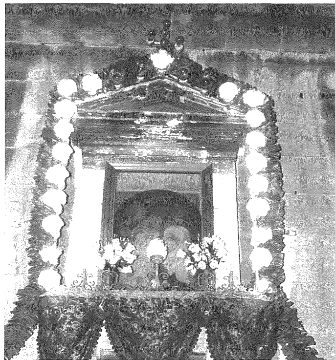
In-niċċa armata għall-okkazzjoni tal-Festa tagħha nhar l-Erbgha 26 ta' Lulju tas-sena l-oħra.

Meta qabel il-Koncilju Vatikan II il-quddies kien isir fl-artali tal-għub, fil-festa titulari ta' San Publu kienu jigu hafna sacerdoti u Religiuzi jqaddsu fil-knisja tagħna fosthom Dun Ġorġ Preca li kien ikun irid iqaddes fl-artal ta' Sant'Anna ma genb in-niċċa l-antika ta'