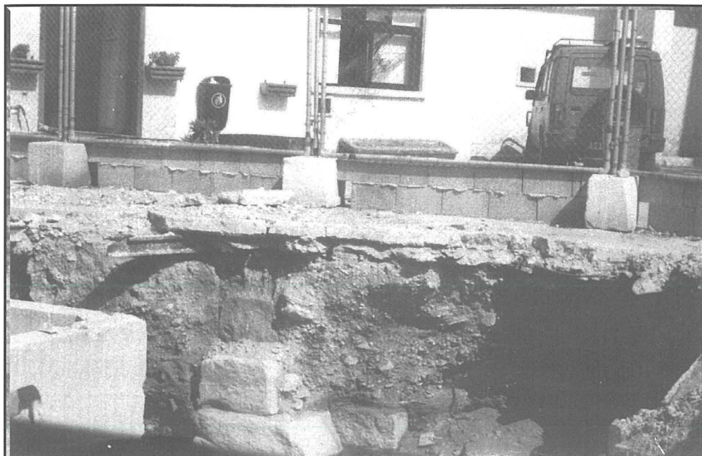
Waqt thammil fiċ-Ċentru tar-refuġjati nkixfu żewġ haġriet kbar tal-Mall jew Baċir Ruman

lejn il-Birgu. Għalhekk lura sa dak iż-żmien żgur li kien hemm il-baħar. Dawn biż-żmien saru għadajjar li nsaddu u f'xi waqtiet kienu ta' dannu għal saħhet il-bniedem minhabba li n-nemus li kien joqghod fuq l-ilma qieghed beda jġib il-mard.