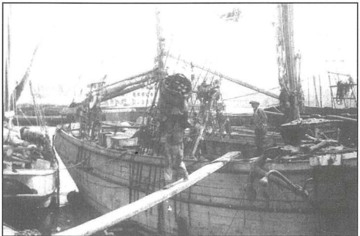
Fahhama jhottu l-faham

Din id-darba tajjeb li flimkien nagħmlu mixja tul ix-xatt kollu tal-Marsa u naraw fejn seta' kien hemm xi fdalijiet mill-imghoddi, ta' kull epoka u żmien differenti. Jingħad x'jingħad, il-periferija tal-Marsa bhala port, tibda mix-Xatt ta' Pinto sa Ras Hanzir. Li ġara hu li minhabba li l-konfini tal-ibliet u l-irhula bdew jinbidlu bil-ligijiet tal-Kunsilli Lokali u minhabba li ċertu xogħol konness mal-Port il-Kbir kellhom jiehdu rwol ieħor, sar dak li sar u l-imħażen ta' Pinto saru Valletta Waterfront imma ġew jagħmlu mal-Furjana waqt li Ras Hanzir ġie inkorporat ma' Raħal Ġdid - Casal Paola. Dan minhabba l-baċir tal-Malta Shipbuilding li qata' kull komunikazzjoni tul ix-xatt u ġie iżolat mill-kumpliment tal-mollijiet fil-Marsa. Kif konna qegħdin ngħidu, l-imħażen ta' Pinto mibnija fuq ix-xatt tal-Marsa bi hdax-il mahzen u biswithom Knisja ddedikata lill-Harba lejn l-Eġittu, inbnew fi żmien il-Granmastru li jgħibu ismu, Manoel Pinto (1741-1773).