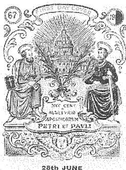
Il-First Day Cover maħruġ fit-28 ta' Ġunju 1967 li juri sett bolol, xogħol ta' Emvin Cremona.

Ma jstax jonqos li bħalma personalitajiet distinti ġew għad-19-il ċentinarju mill-Miġja ta' San Pawl f'Malta fl-1960, hekk ukoll reġġu ġew biex jiċċelebraw id-19-il ċentinarju tal-Martirju ta' San Pietru w San Pawl. Fost dawn insibu lill-Kardinal Ildebrando Antoniutti u l-Kardinal Paolo Marella.