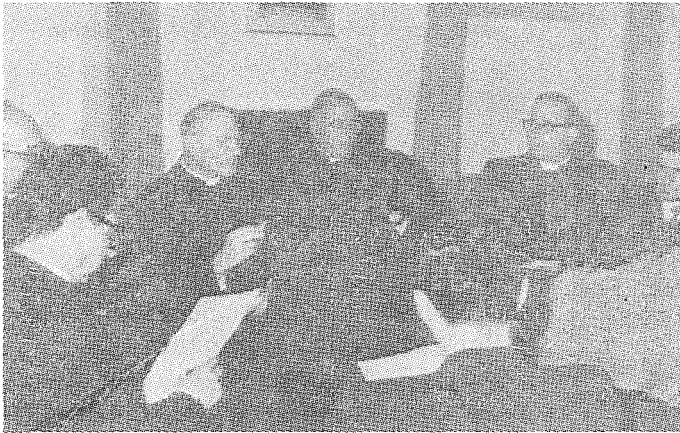
Il-Konferenza Stampa dwar il-Festi tad-Dsatax-il Ċentinarju tal-Martirju ta' Appostli San Pietru u San Pawl.

Minn snin qabel ir-Rabtin bdew jippreparaw bis-siġħ għal dan iċ-ċentinarju fosthom billi saru sett pavaljuni godda għal Triq Konti Ruġġieru w għe restawrat l-Ark wara