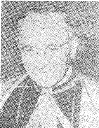
Il-Kardinal Ildebrando Antoniutti

Twieled f'Nimis (Arċidjoċesi ta' Udine, l-Italja) fit-3 ta' Awissu 1898; ġie ornat saċerdot fil-5 ta' Diċembru 1920, ġie