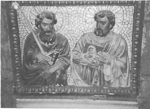
San Pawl u San Luqa fi skultura sabiħa li tinsab fit-taraġ li mill-parroċċa ta' San Pawl kien jagħti għall-Grotta.

Fit-taraġ li semmejna, li mill-knisja kien jagħti għall-Grotta, wieħed għad jista jara skultura oħra sabiħa li turi 'l San Pawl flimkien ma' San Luqa (it-tnejn mezz figur), iż-żewġ persunaġġi li t-tempesta kaxkrithom fi gżirtna. San Pawl qed