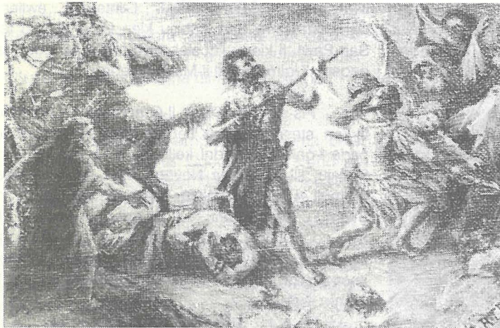
Buzzett ta' Lazzaro Pisani li juri il-Martirju ta' San Pawl u li kien maħsub li jsir għall-Parroċċa tar-Rabat.

Il-pittur tal-knisja tagħna saret fi żminijiet reċenti u l-ewwel ma tpitru kienu l-lunetti