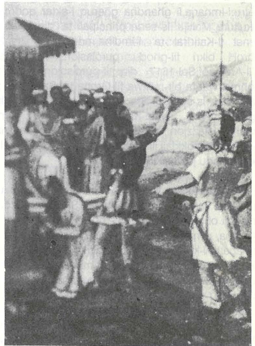
Kwadru mill-Polittiku ta' San Pawl li juri il-Martirju Tiegħu.

L-istil ta' dan il-kwadru hu dak manjerista, li qabel mad-data li hemm imnila fuqu, 1588. Ix-xena tal-Martirju hi mpittra fuq sfond tal-kampanja, b'diversi għoljiet. Fin-nofs lemini tal-kwadru jiddominaw l-għoljiet kif ukoll is-suldat bojja li qed iġollu x-xabla 'l fuq waqt li fuq il-lemin tiegħu hemm iċ-ċenturjun u figura femminili li skond it-tradizzjoni kienet Lucina. Il-parti tax-xellug