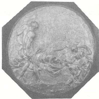
Il-Medaljun li juri l-Martirju ta' San Pawl, xogħol fil-bronż indurat ta' Alessandro Algardi.

B'dan il-kumment fuq il-medaljun ta' Algardi nagħliqu l-konsiderazzjoni tagħna tal-interpretazzjonijiet artistici tal-Martirju ta' San Pawl fil-Kolleġġjata tagħna, f'din is-sena li fiha qed infakkru f'it aktar mis-soltu din il-ġrajja mbierka li nkurunat il-missjoni ta' l-Appostlu Missierna fid-dinja u wasslitu għat-trijonf tiegħu fis-sema fejn qed jinterċedi għalina.