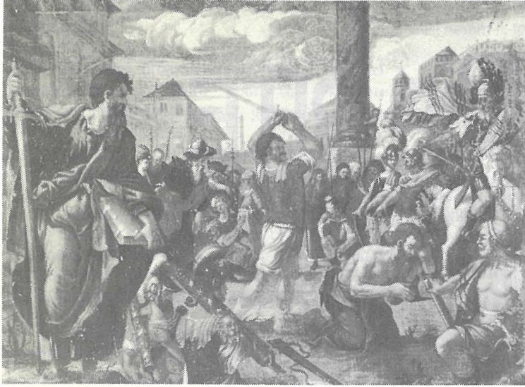
Il-Martirju ta' San Pawl fis-sett ta' tnaħ il-kwadru li juru il-Martirju tat-tnaħ l-Appostlu.

l-Ordni, sett ta' tnaħ il-kwadru li juru l-martirju tat-tnaħ l-appostlu. Dawn għadhom konservati sallum fuq il-kaxxerizzi, fi gwarniċi li jidher li mhumieħ originali iżda saru wara.