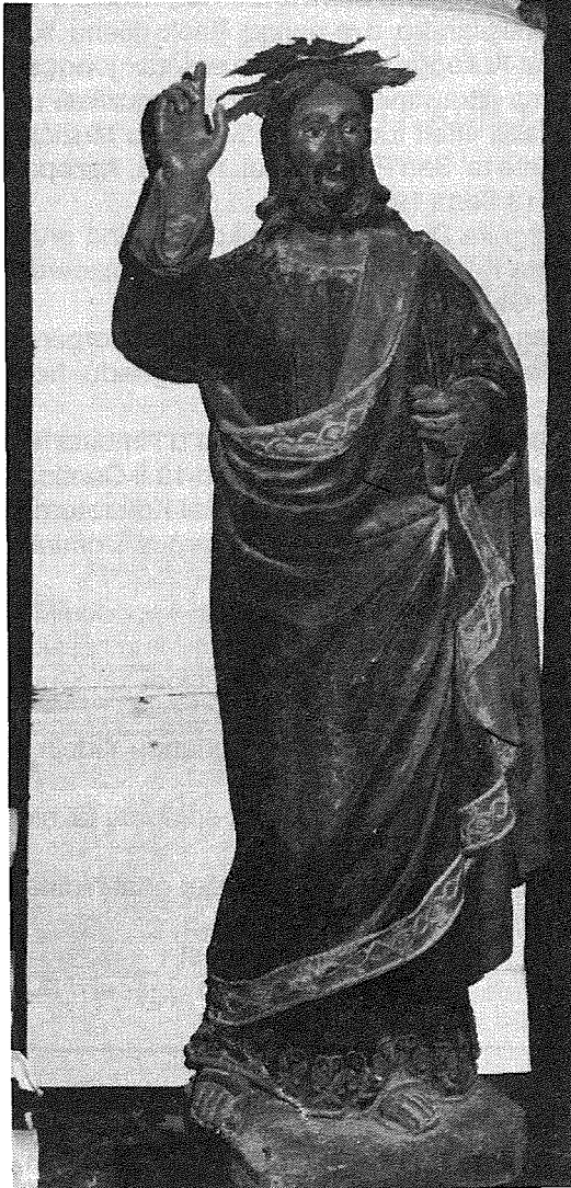
Kristu tal-Hobża li kien jintrama u jinżamm fit-tieqa tal-faċċata flok Kristu Salvatur li hemm illum. (Ritratt J. Scerri).

Nru. 10, Sena 1986) jew aħjar kif inhi magħrufa mar-Rabtin bħala Kristu tal-Hobża. Wieħed jista jgħid li din l-istatwa barra li hija simbolu tal-festi esterni ta' Corpus Domini, hija wkoll marbuta ma tradizzjoni li toħodna lura għal-aktar minn mitt sena.