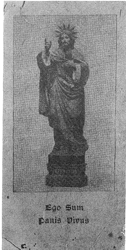
Santa popolari li turi l-istatwa ta' Kristu tal-Hobża li għada tintrama sal-llum. xogħol K. Mallia

L-istatwa ta' Kristu tal-Hobża li għada tintrama sal-llum kienet maħduma mill-istatwarju Karmenu Mallia magħruf aħjar bħala l-Lhudi (1880-1930). Ftit huma dawk li jafu li din l-istatwa ġiet imħallsa mis-Sur Francesco