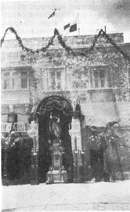
L-Ark ta' Kristu armat fit-Triq S. Pawl faċċata ta' Strada Rjali. Iż-żewġ linef tal-Kristall illum jinsabu jżejnu it-Titular tal-Kollegġjata. Jideher ukoll l-Ornat tal-Hadid tat-Tazzi taż-Zejt.