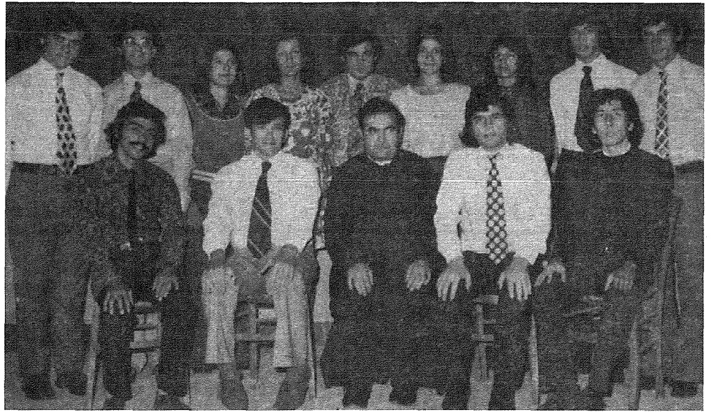
Dun Tarċis bħala President jidher mal-Kumitat tal-Għaqda Rikreattiva u Kulturali ghas sena 1973-74.