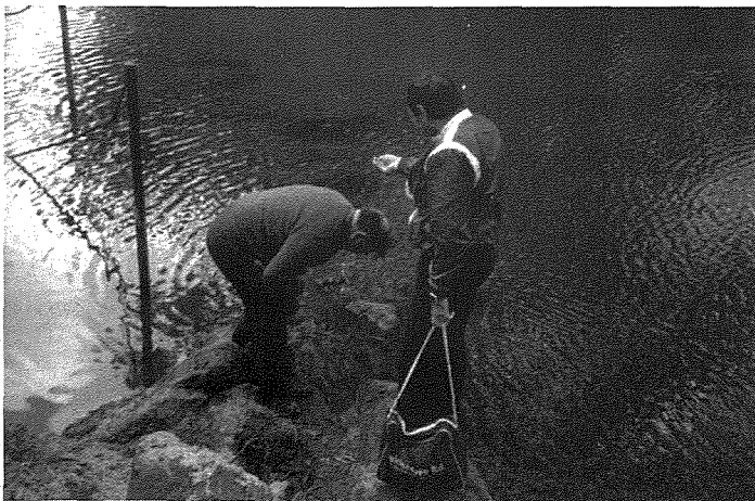
Meta żar l-Art Imqaddsa