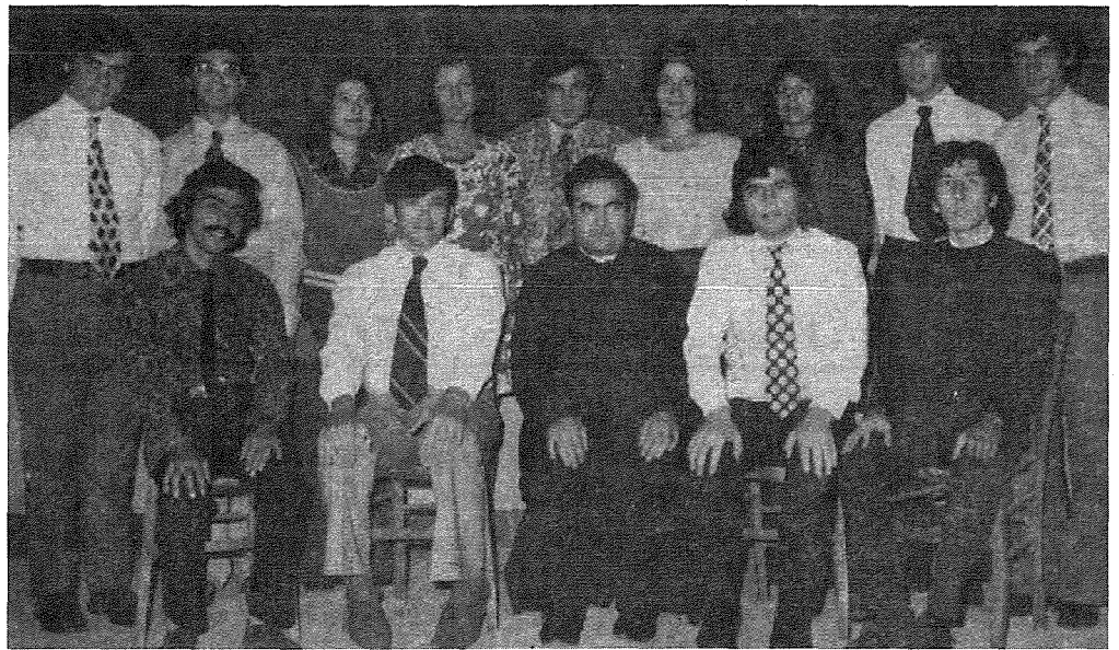
Dun Tarčis bhala President jidher mal-Kumitat tal-Ghaqda Rikreattiva u Kulturali ghas sena 1973-74.