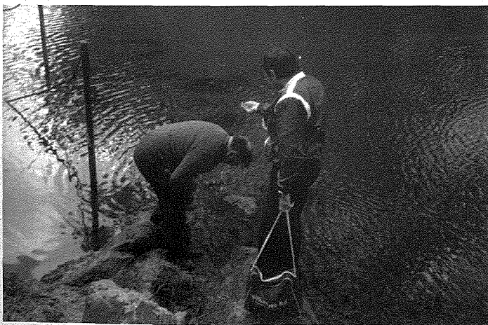
Meta żar l-Art Imqaddsa