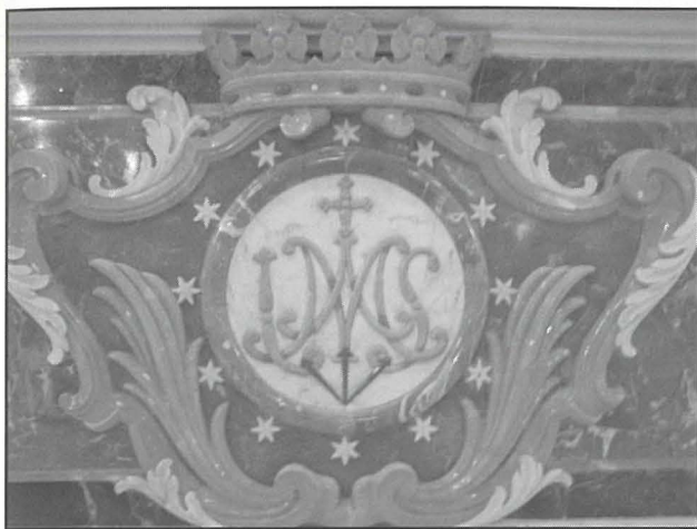
Dettal ta' l-arma fuq quddiem tal-mejda.

s-sinifikat ta' l-artal mas-sagrificċju li Ġesù għamel għalina fuq is-Salib. L-arma hija mdawra bi tnaħ-il kewkba li huma s-simbolu assoċjat mal-Assunzjoni ta' Ommna Marija. Taht l-arma naraw żewġ palmiet li jfissru l-martirju u r-rebħa. L-arma kollha hija mdawra bi skultura ta' weraq u disinji skolpiti f'irham abjad u isfar u nkurunata b'kuruna skolpita f' irham isfar. Sfortunatament din l-arma ma tkunx tista titgawda fi granet ta' festa peress li titgħatta bil-ventartal.