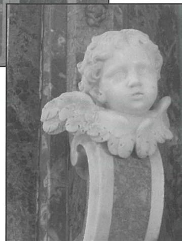
Wiehed mill-puttini ta' madwar il-ġilandra li saret fl-1776.

Hija xi haġa tajba u sabiħa li tapprezza l-arti u s-sagrificċji li jkun għamlu n-nies ta' qablek biex tkun tista' tgawdih int ukoll. Imma sabiħ kemm hu sabiħ l-artal, ma nistgħux ninsew li dak li hemm ippriservat ġo fih huwa hafna isbaħ u akbar. Dan kollu kien sar biex jippriservaw teżor kbir; Alla magħna f'kull hin tal-ġurnata. Mela tajjeb li ma nieqfux biss inharsu u napprezzaw is-sbuhija ta' l-irham kiesaħ, imma naghmlu pass iehor, ninzlu arkupptejna, ninvistaw is-sagrament u nħossu s-shana ta' l-imhabba tiegħu tmissilna qalbna.