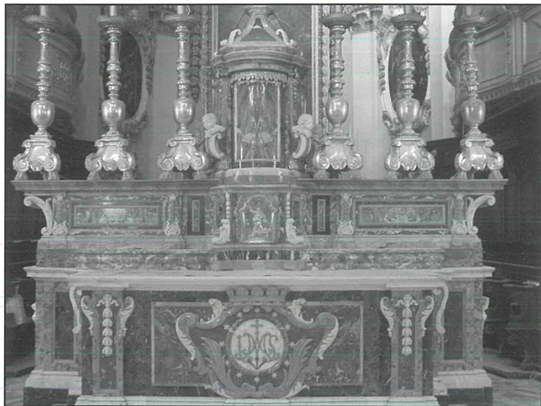
L-artal maġġur fil-knisja parrokkjali ta' Hal Ghaxaq.

Wara l-konverżjoni ta' Kostantinu, ir-religjon nisranija setgħet toħroġ fil-beraħ u b'hekk bdew telghin l-ewwel tempji insara f'Ruma u fl-Art Imqaddsa. F'dawn it-tempji Nsara, li kienu ispirati mit-tempji pagani Rumani, bid-differenza li fiċ-ċentru dejjem kellhom l-artal mejda li fuqha kienet issir it-tifikira ta' l-Aħhar Ikla tal-Mulej. Mal-mixja taż-żminijiet, stili differenti ta' arkittettura bdew jintużaw biex jinbnew tempji akbar u isbah. Fi żmien rinaxximentali, l-artal ma baqax forma ta' mejda biss. Fuq wara tal-mejda żdiedu bhala xkafef fejn jitpoġġew ix-xemgħat u tiżjin iehor. Minn dan iż-żmien l-artal ma baqax wahdu fin-nofs, imma fil-knejjes beda jidher l-artal maġġur fiċ-ċentru tal-