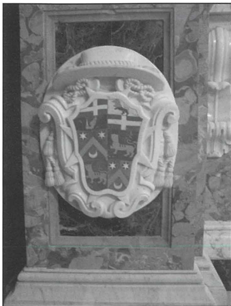
Dettall ta' wahda mill-armi fil-ġnub ta' l-artal maġġur.