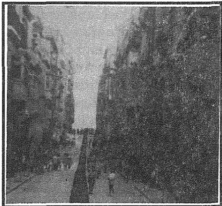
Il-Kazin fejn kien fi Triq Miratur, jidher biss il-fanal fuq il-bieb.

Iżda darba riduni President. F'perjodu ta' Prezidenza ga okkupata u qed tiffunzjona, bla ma nsemmi l-annu tagħha, lili kienu haduni quddiem avukat f'post Barcellona