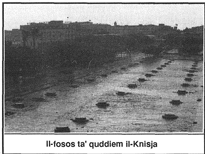
Il-fosos ta' quddiem il-Knisja

Fis-snin ta' wara l-Ingliżi komplew ibiddlu l-fizjonimija tal-Floriana b'mod radikali. Fi żmien meta kien Gvernatur ta' Malta Richard More O'Farrell (1847-1851), l-uniku Gvernatur Kattoliku li kellha Malta, kienu saru l-Fosos ta' quddiem il-Knisja ta' San Publu fil-waqt li fl-1868 gie inawgurat it-tieni bieb tal-Bombi... u baqgħu sejr in b'dan l-iżvilupp sew 'il quddiem fis-seklu li qegħdin fih.