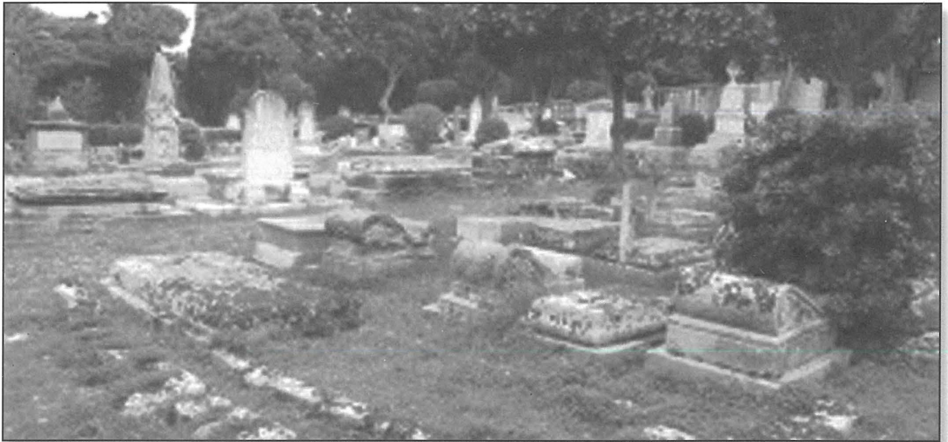
Iċ-Ċimiterju ta' Braxia

ċimiterju tal-Ingliżi f'Malta u l-fatt li dawn għażlu lil Floriana biex iwaqqfu l-ewwel post ta' mistrieħ ta' dejjem għal qrabathom u hbiebhom jikkonferma kemm raw fil-Floriana sa minn kmieni, ċentru attraenti għall-ħtiġijiet spiritwali tad-denominazzjonijiet Protestanti varji tagħhom.