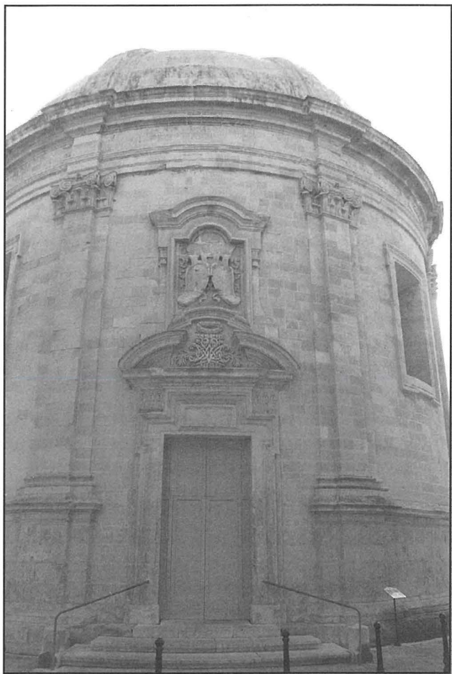
Il-Knisja tal-Immakulata (Sarria)

mill-qrib, proprju faċċata u kważi fuq l-ghatba tal-Methodisti, sa mill-anqas l-1940 kienu jsiru diversi funzjonijiet reliġjużi għall-Kattoliċi Ingliżi, eżattament fil-Knisja ta' Sarria, *18 u maż-żmien f'din il-knisja kien ġie organizzat ċentru għall-membri Kattoliċi tal-forzi armati Ingliżi stazzjonati f'Malta.