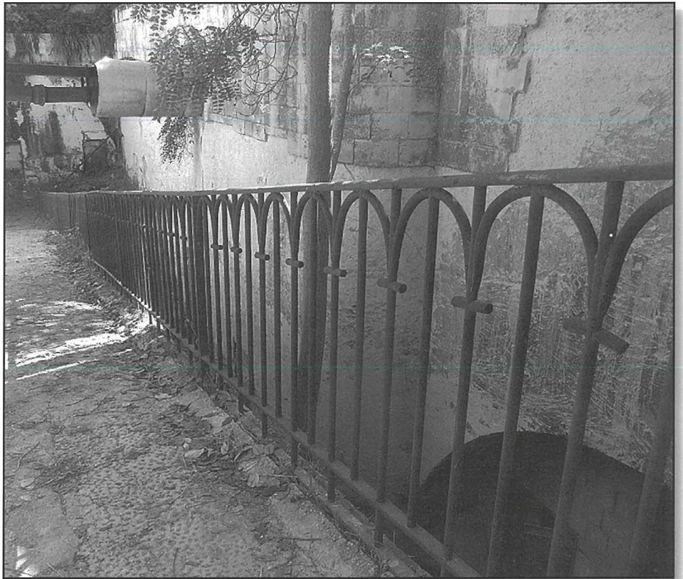
Ir-rampa li twasslek għall-mina tal-istazzjon tal-'ferrovia'

L-aħħar vjaġġ tal-Vapur Tal-Art sar 82 sena