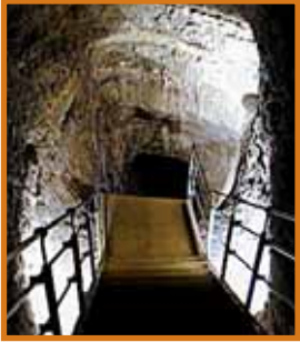
Mina ta' Warren fil-Belt ta' David

Skavi reċenti urew li filwaqt li Warren irnexxielu jikkxef sezzjoni importanti minn din is-sistema idrawlika sigrieta, hu ma kienx jaf li l-mina sigrieta kienet tkompli għal 10 metri oħrajn fil-blat samm, u kienet twassal f'sala li fiha kien jasal l-ilma, u li kienet il-ħażna tal-ilma tal-belt. Dan fil-fatt jista' jkun il-post li għalih David jirreferi f'2Sam 5,8.