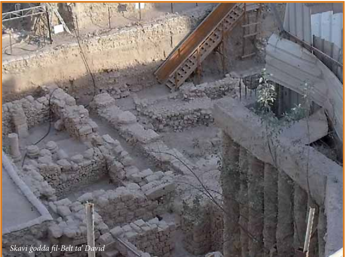
Skavi godda fil-Belt ta' David

Fil-profezija ta' Natan f'2Sam 7,1-7 insibu riferiment iehor