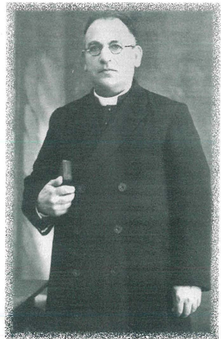
Dun Karm Vella meta laħaq Saċerdot fit-23 ta' Diċembru 1922