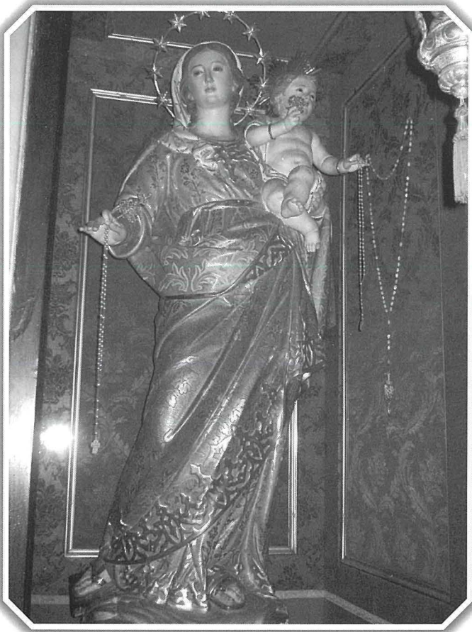
Il-Madonna tar-Rużarju ta' Pietro Paolo Azzopardi fil-Knisja ta' Bormla

fil-purċissjoni tal-Ġimgħa l-Kbira ġewwa Bormla huma Ġesù marbut mal-Kolonna u l-Ecce Homo li kienu magħmula bejn l-1838 u l-1841. Statwi oħra li għamel Pietro Paolo kienu Sant'Agata għal Bormla (1846), Is-Sejba tas-Salib (1862) vara bi tliet figuri li issa tinsab fl-