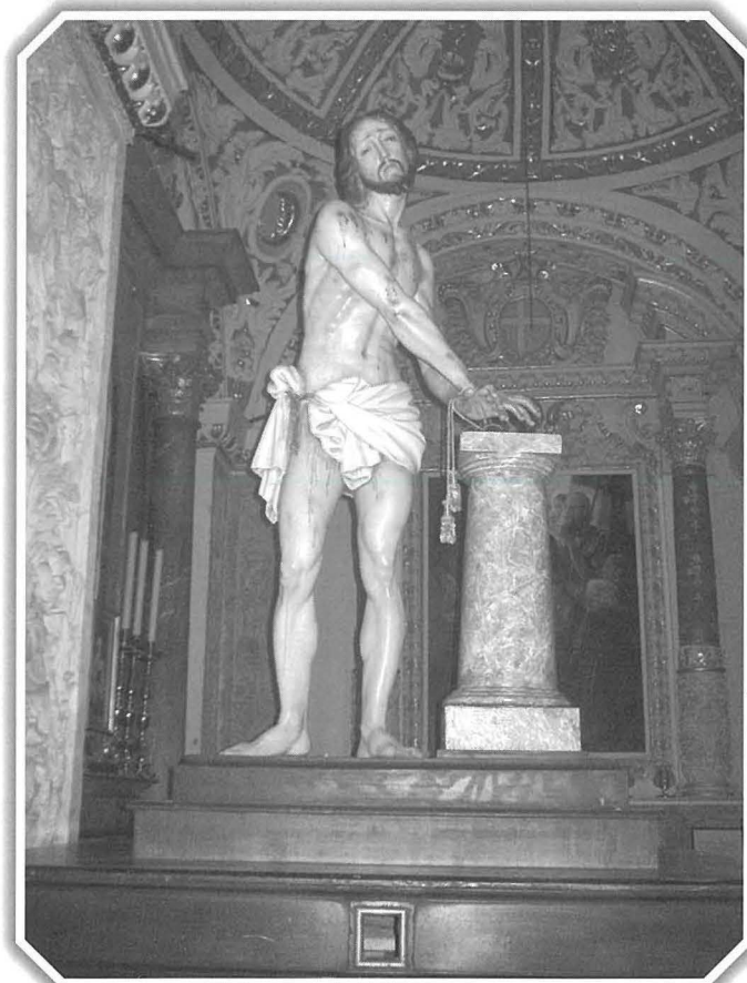
F'Ta' Ġiezu, xogħol ta' Pietro Paolo Azzopardi

Fil-ħanut tal-belt, Pietro Paolo, għamel ukoll l-istatwa titulari tal-Mellieħa, il-Bambina (1853). Għamel ukoll l-istatwi titulari ta' San Ġorġ tar-Rabat, Għawdex (1839) u ta' San Ġwann għax-Xewkija (1845). Il-Konfraternità tas-Salib Imqaddes tal-Belt Valletta qabdet lil Azzopardi jagħmlilha statwa ta' Kristu marbut mal-kolonna (1834). Żewġ vari oħra li jintużaw