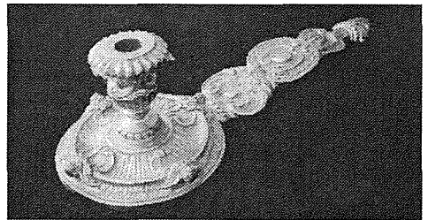
Buġija tal-fidda mogħtija lill-knisja mid-dilettanti tan-nar fl-1960

Nota: Nisperaw li f'dan l-artiklu ma hallejna lil hadd barra. Niskużaw ruhna jekk forsi ġara dan.