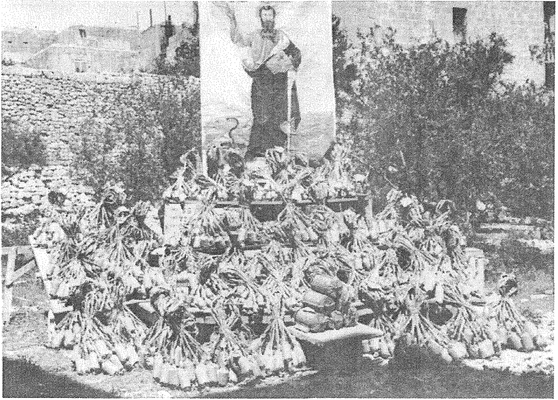
Kaxxa nfernali għall-Festa ta' San Pawl 1949

żjara li kien ghamel il-Prince of Wales.