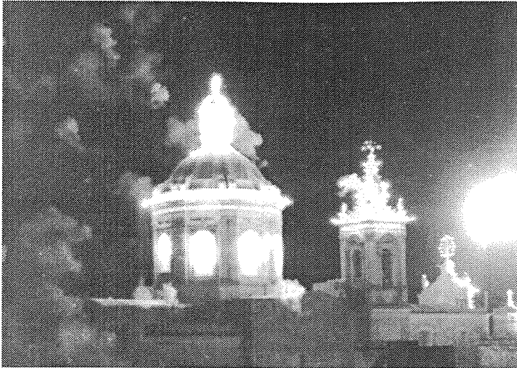
Il-Kaxxa nfernali mahruqa mill-foss ta' wara l-Knisja Proto-Parrokkjali.

In-numru ta' dilettanti tan-nar Rabtin Pawlini kien dejjem wiehed kbir u fih kien jinkludi nies minn kull strata