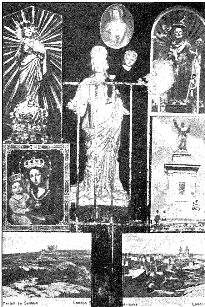
Santa mahruġa mill-Parroċċa tal-Mellieha fl-1906 bit-talpa tal-Madonna fuq wara

Matul in-noveni tal-Vitorja kien isir serbut bil-maskli mill-Mithna sas-Santwarju. Dawn illum m'ghadhomx isiru. Sakemm ma kienx hawn id-dawl elettriku, li wasal il-Mellieha fl-1949, it-toroq u ż-żewġ knejjes kienu jiżżejnu bit-tazzi tal-ħgieg ikkuluriti, mimlijin biż-żejt ta' l-ikel u kienu jinxteghlu bil-lumini (ftila tat-tajjar tgħum fiż-żejt permezz ta' tliet biċċiet sufri żgħar). Fil-bnazzi kien ikun fihom ghaxxa, pero' fir-rih u bix-xita kienu jintfew. Kien inkarigat mill-armor tat-tazzi ċertu Patist minn Haż-Żebbuġ, Malta. Kellu ohrajn mieghu, aktarx uliedu.