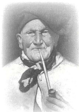
Portrait - Kollezjoni privata