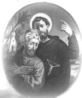
San Frangisk Saverju