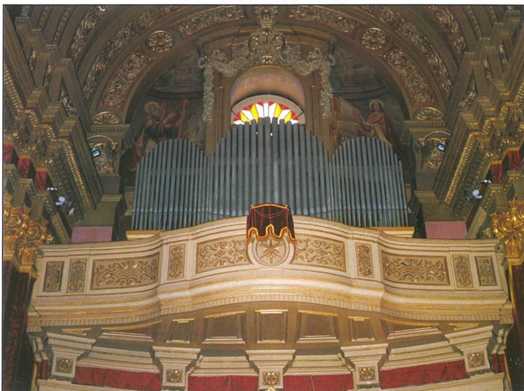
Il-gallerija ta' l-orgni tal-knisja arċipretali taż-Żejtun.

Nistghu nġiddu li kważi għaddew mitt sena mindu tlestiet din l-opra artistika, u bħal kull haġa ohra li jgħaddi ż-żmien minn fuqha, jidher li wasal il-waqt li xi hadd ta' l-affari tiegħu jdur dawra madwarha, biex jara xi htieġa għandha ta' restawr. Hi ġawhra ohra li żzejjen lill-knisja parrokkjali tagħna, b'mod speċjali fil-jiem għeżieħ tal-festa ta' Santa Katerina. 16