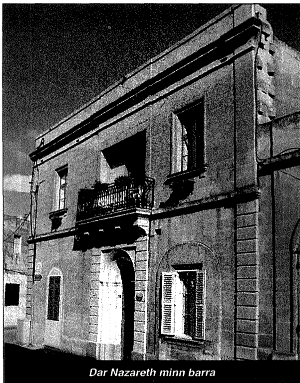
Dar Nazareth minn barra

Ix-xogħol volontarju f'Dar Nazareth ma waqaf qatt. Hemm kull sura ta' xogħol volontarju: koki, hassiela, dawk li jagħmlu manutenzjoni, professjonisti, dawk li jzommu l-kontijiet ta' x'jidhol u x'johroġ halli darba fis-sena nohorgu rapport finanzjarju magħmul minn ditta apposta ta' "accountants". Fuq kollox hemm dawk il-koppji li nhar ta' Hadd u fil-festi pubbliċi jiehdu post il-koppja