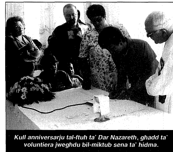
Kull anniversarju tal-ftuh ta' Dar Nazareth, għadd ta' voluntiera jwegħdu bil-miktub sena ta' hidma.

Id-dinjita` tidher ukoll fejn jidhlu l-flus. Id-Dar ma tiehux il-pensjoni kollha li għandhom ir-residenti.