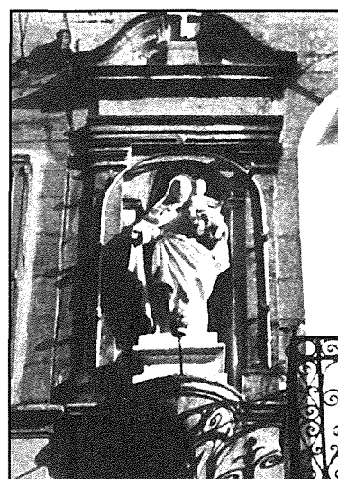
Mosta: Triq Callus