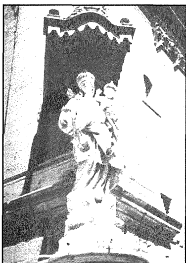
Mdina: Triq Villegagnon