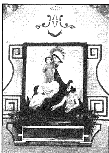
Hal Qormi: Fit-triq ta' Hal-Luqa