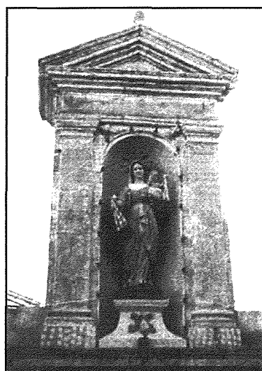
Żurrieq: Triq il-Fjuri