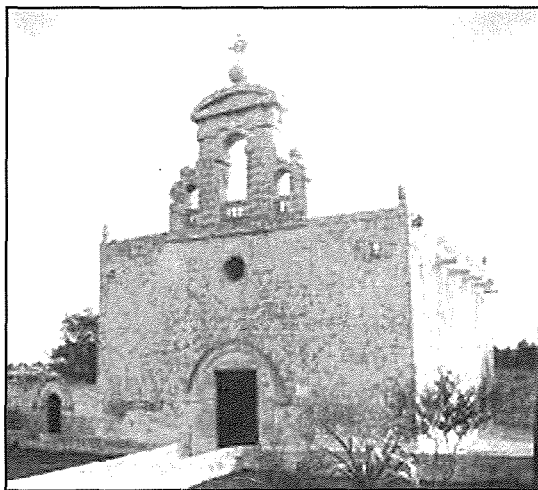
Il-knisja ta' Bir Miftuħ

F'dawk iż-żminijiet, f'Hal Tarxien kien hawn 11-il kappella. Dawn kienu l-kappelel ta' San Luqa, San Nikola, il-Konverżjoni ta' San Pawl, Marija Annunzjata, il-Viżitazzjoni tal-Madonna lil Sant'Elizabetta, Santa Marija (l-Assunta), San Leonardu, San Gwann Battista, San Nikola