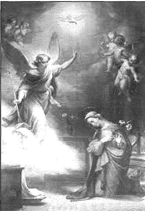
Il-kwadru titulari ta' Marija Annunzjata