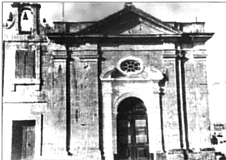
Il-Kappella tal-Madonna tal-Karmnu li kienet mibnija fejn illum hemm Triq Haż-Żabbar