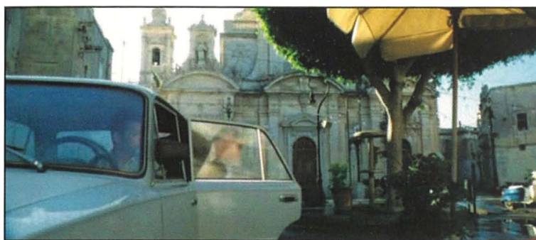
Xena mill-film 'Munich' fil-pjazza taghna

ghajnejn id-direttur waqghu fuqu. F'din is-sensjela Ingliza li ghadha popolari hafna fl-Ingilterra sal-lum il-ġurnata tispikka wkoll il-pjazza l-antika qabel ma twaqqat l-bini faċċata tal-knisja.