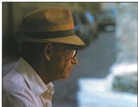
Ġanni Ciangura ta' Sigaretti fil-film 'Black Eagle'