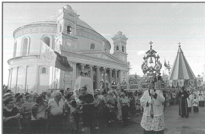
It-Tintinnabulum u l-Umbrellun fil-purċissjoni ta' Marija Mtellgħa s-Sema ġewwa l-Mosta, żewġ simboli relatati mal-Bażilika. Fl-isfond tidher ir-Rotunda mghollija għad-dinjità ta' Bażilika.