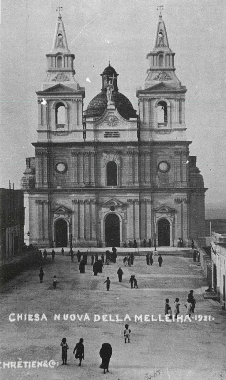
Il-Knisja Parrokkjali tal-Mellieha fl-1921