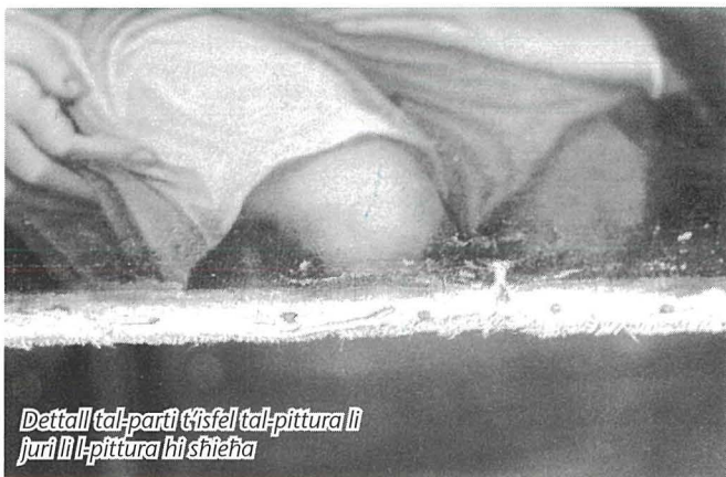
Dettall tal-parti t'isfel tal-pittura li juri li l-pittura hi shieha

biss. Fl-ambjent ekkleżżjastiku normalment kien jintalab is-servizz ta' Zahra, iżda l-membri ta' l-Ordni kienu jippreferu lil Favray, kif ġieli għamel ukoll Alpheran de Bussan, Franciż huwa wkoll, bħal fil-każ tal-kwadri ewlenin għall-kappella tas-Seminarju fl-Imdina 2 . L-attribuzzjoni għal Favray hija ovvja.