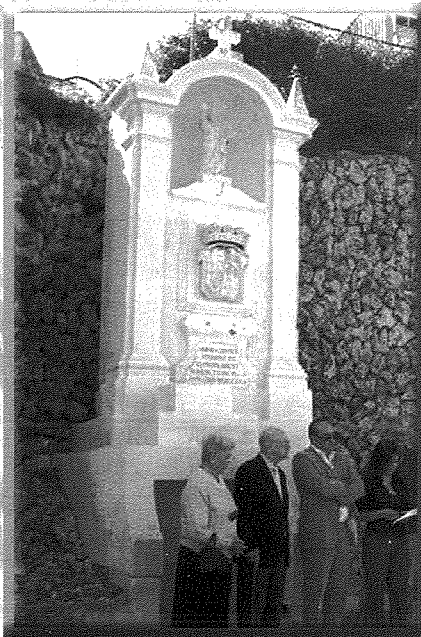
Għajn Rażul f'San Pawl il-Baħar

San Pawl, u (7) l-għajn jew bir ta' ilma ġieri li jingħad li kien ħareġ għat-talb ta' San Pawl.