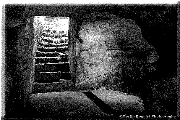
Il-Bazi tal-Bir li jinsab fil-Kripta tal-Madalena

Ħafna devoti kienu jixorbu minn dak l-ilma b'devozzjoni iżda dan gie projbit madwar is-snin 1930 minħabba periklu ta' kontaminazzjoni. Dan ifakkarna fl-ilma ta' Lourdes li, bla ebda periklu ta' kontaminazzjoni, ħafna għadhom jixorbu minnu u jinħaslu fih b'devozzjoni.