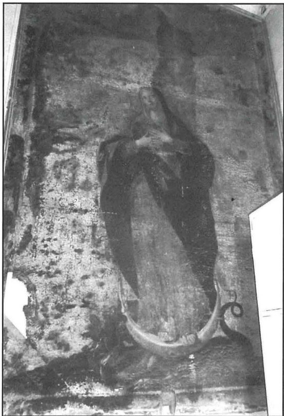
Il-kwadru l-antik tal-Kuncizzjoni, xogħol anonimu (qabel 1636)