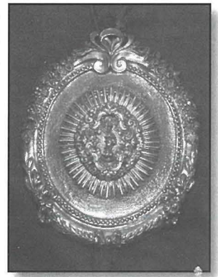
Il-medaljun tar-Rettur tal-Fratellanza