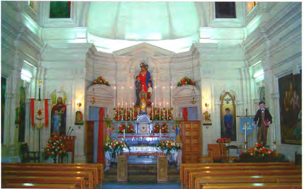
Il-kappella armata għall-festa tal-Qalb ta' Ġesù fl-2005. Fuq ix-xellug tidher it-tieni bandalora tal-Oratorju, waqt li fuq il-lemin tidher il-bandalora tal-Għaqda Studenti Mostin wara l-istatwa ta' San Domenico Savio.