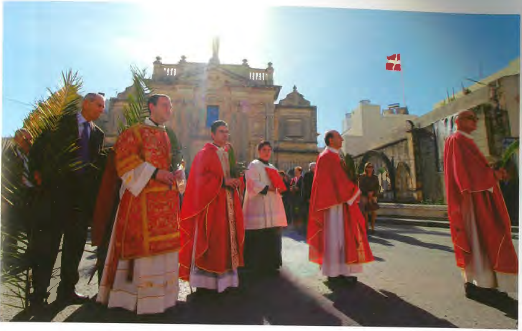
Il-purċissjoni ta' Hadd il-Palm li tibda mill-kappella tal-Oratorju u tibqa' sejra lejn il-knisja arċipretali. Minn ġurnata qabel, il-kamra ta' barra fl-Oratorju timtela frieghi taż-żebbuġ biex il-Ħadd filghodu jingarru mit-tfal waqt il-purċissjoni.