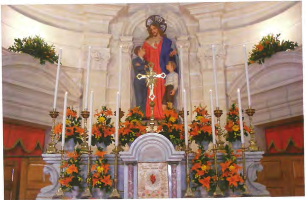
L-artal maġġur tal-Oratorju mzejjen għall-festa tal-Qalb ta' Ġesù tal-2009. F'wiehed mis-swaba' ta' Ġesù għad hemm sal-lum iċ-ċurkett li omm Dun Anġ, Natalizia, kienet irregalatlu.