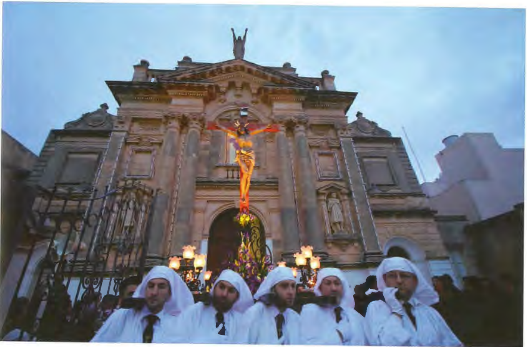
L-2016 giet imsejha s-Sena tal-Hniena minn Papa Franġisku. Għal din l-okkażjoni sar pellegrinaġġ speċjali bis-salib tal-vara l-kbira li mill-Oratorju telaq f'purċissjoni għar-Rotunda.