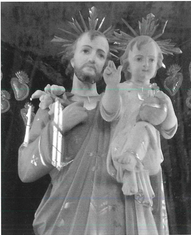
Statwa ta' San Ġuzepp fil-Knisja ta' Santa Maria ta' Ġesù (Ta' Ġiežu) ġewwa l-Belt Valletta

Fil-Bażilika tal-Porto Salvo magħrufa aħjar bħala ta' San Duminku, insibu statwa ta' San Ġuzepp bil-Bambin f'idejh. Din xogħol tal-kartapesta mill-