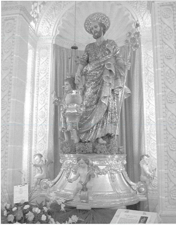
Statwa ta' San Ġużepp fil-Knisja tal-Madonna tal-Karmnu, il-Belt Valletta

jzommu f'idejhom għodda marbutin mas-sengħa tal-mastrudaxxa maħduma fil-fidda. Jingħad li din l-istatwa originarjament kienet ta' San Pietru u giet adattata għal San Ġużepp billi żdiedet il-figura tat-