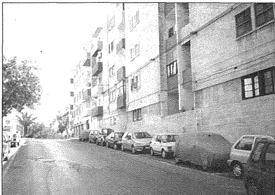
Triq Dun Ġorġ Preca

Illum dan il-bini qed jintuża mill- Hamrun Boys' Scouts u Girl Guides u grazzi għalihom, dan il-post storiku għadu jista' jitgawda u għadu miżmum fi stat tajjeb hafna.