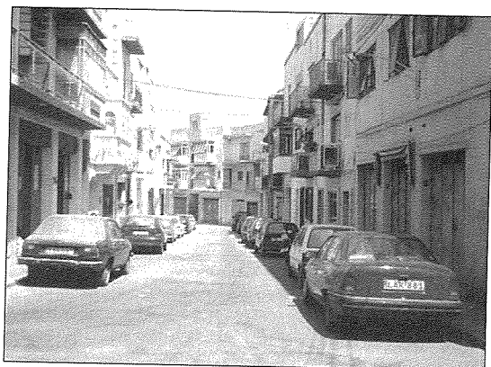
Triq Enrico u Tereza Nuzzo