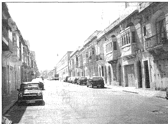
Triq Ġuże' Pace

Se nibdew billi naghtu titwila lejn wahda mit-toroq l-aktar wisgħin li nsibu fil-Hamrun, Triq Ġuże' Pace . Qabel ma nġhatat dan l-isem din it-triq kien jismha Victoria Avenue . Ovvjament l-isem Victoria Avenue kien tifikira tar-Reġina Victoria tar-Renju Unit, Reġina li damet snin kbar fuq it-tron u li s-sena l-ohra kien imfakkar għeluq il-mitt sena mill-mewt tagħha fl-1901.