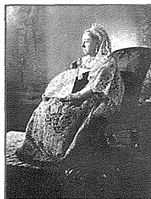
Ritratt uffiċjali tal-Ġublew tad-Djamanti tar-Regina Victoria (1819-1901)